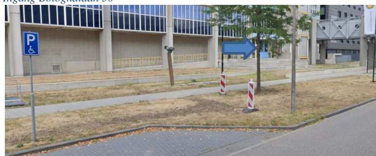
Ingang Yalelaan 2

Indien gewenst halen wij u hier op met onze rolstoel.