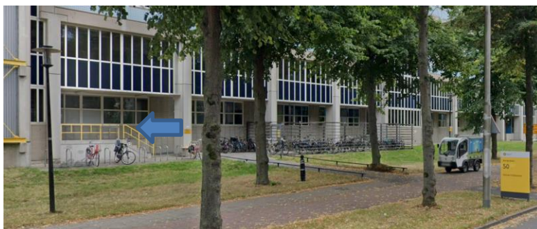
Ingang Bolognalaan 50

Loop via het perron van de sneltram terug naar de kruising Bolognalaan – busbaan. Sla linksaf. Nieuw Gildestein is het tweede gebouw links, voorbij de inrit van de parkeergarage.